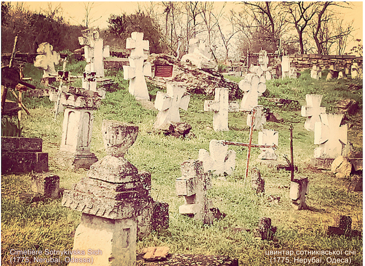
Сіметире Сотниківська Січ (1775, Нерубай, Одеса)