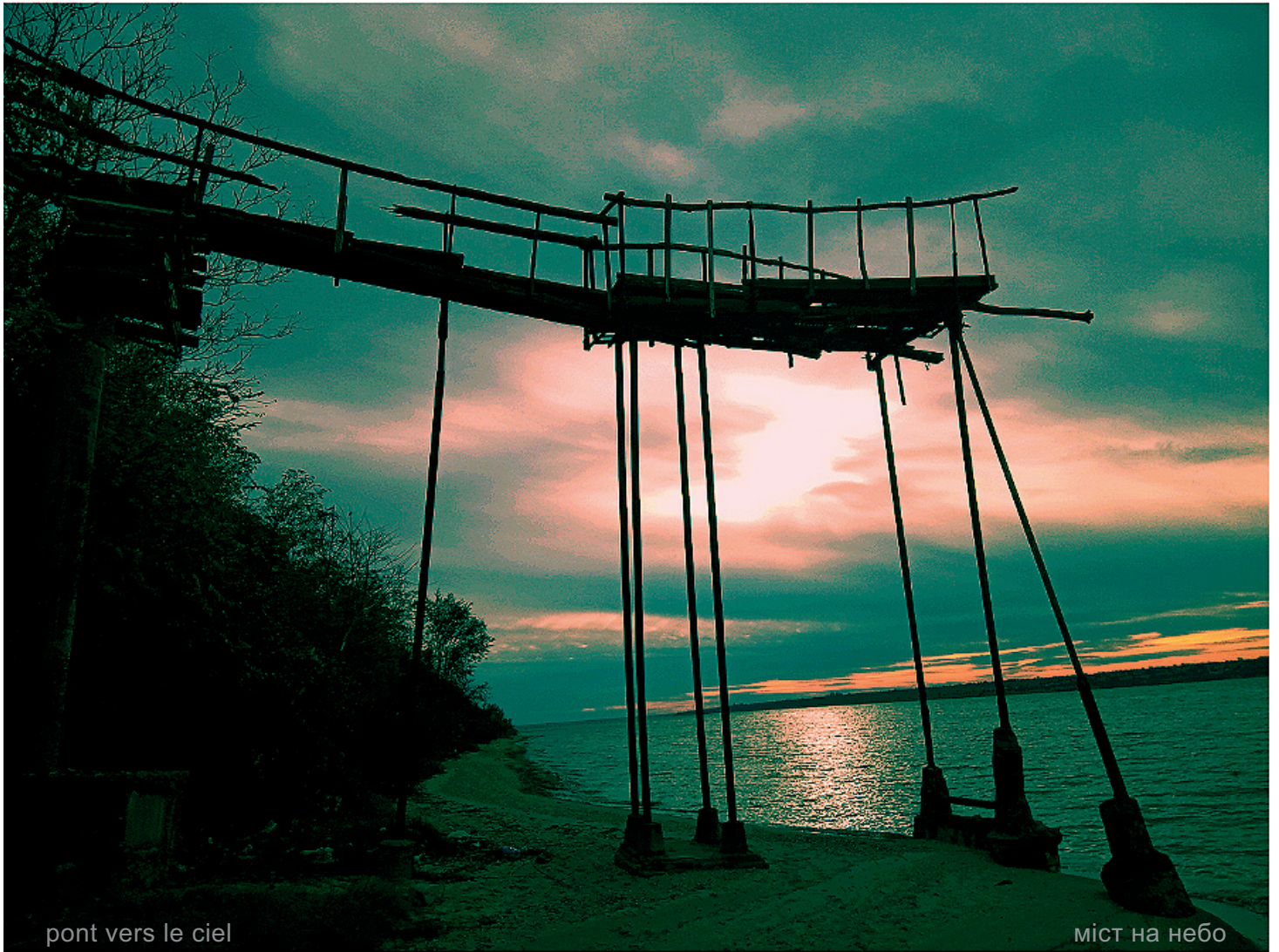
pont vers le ciel